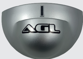
RADAR FOTOELÉTRICO CÓD. 2010342